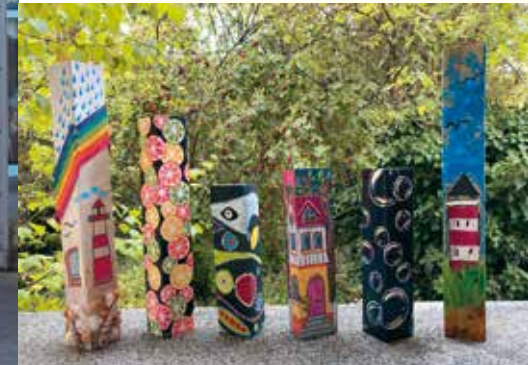
Die Stelen gibt es in den verschiedensten Größen. Von ca. 30 cm bis zu ca. 140 cm.

Die Mitglieder des Vereins Kunst in Rödermark starteten am 19. Mai 2022 eine Kunstaktion, mit der Bildende Künstler aus der Ukraine unterstützt werden sollen.